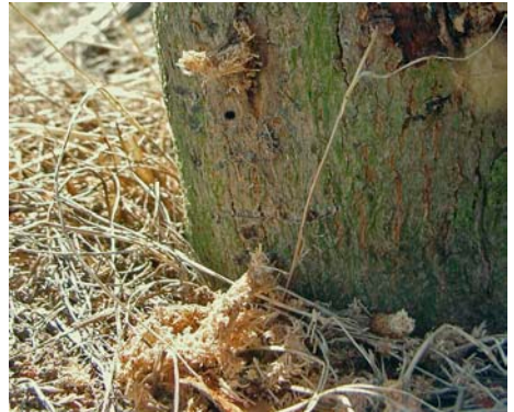
Bohrspäne unter dem Ausbohrloch